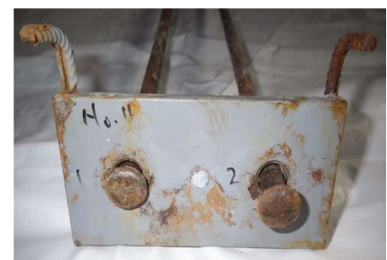
写真4 エポキシ粉体塗装剥離状況

参考文献 1)星 幸江, 武藤義彦, 吉浦 聖, 横川勝則, 板橋正春:耐塩害性防振まくらぎの開発, 土木学会第70回年次学術講演会, 2015年9月