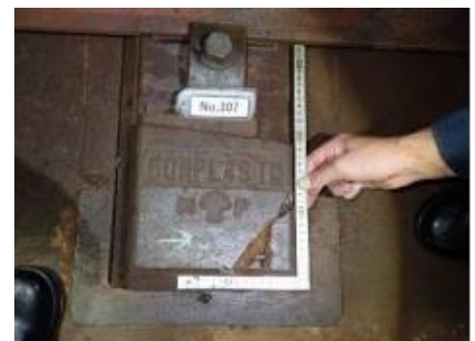
写真2 上部より撮影〈改良型〉

4項の通り、補強鉄筋上部に発生するクラックより浸入した高濃度塩化物イオンを含む水分により補強鉄筋が腐食し爆裂に至ると特定したことから、補強鉄筋を組み込まない構造を検討することとした。2021年度より補強鉄筋を外した耐塩害性防振まくらぎを敷設し観察を開始した。これにより補強鉄筋がももど発生するまくらぎ端部クラックを防ぎ、これまでの弾性材巻き立て、金属部へのエポキシ塗装といった対策と併せることで、さらなる軽減が見込めると考えられる。今後も劣化状況の観察・調査を継続し、本まくらぎの軽減効果について検証を重ね、より軽減効果の高い軌道構造への改良に努めていきたいと考えている。