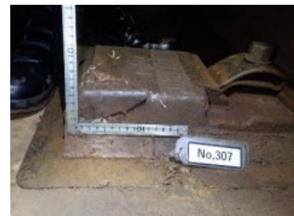
写真3 側部より撮影〈同上〉