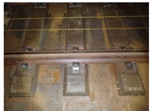
写真1 観察対象まくらぎ