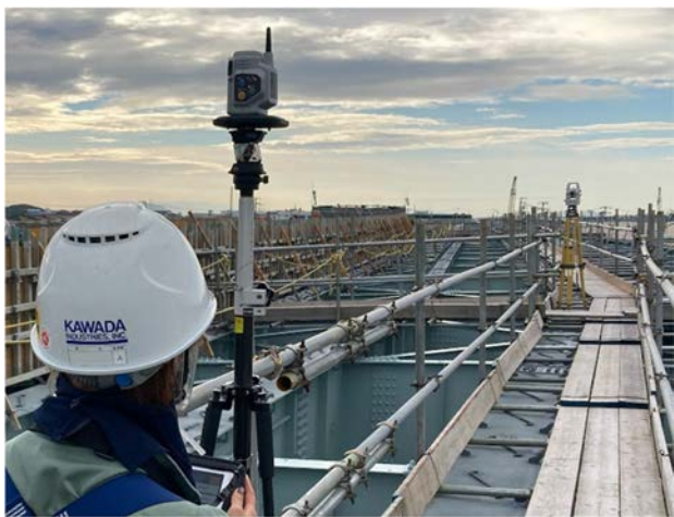
図2 ワンマン測量システムによる作業状況