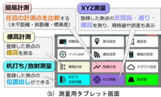
図1 ワンマン測量システムの概要