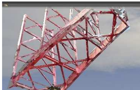
(b) 3D モデル