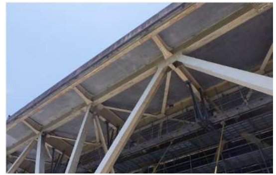
図-3 計測箇所(深沢橋)

鋼トラス橋の既設床組部材で、新設する補強部材と既設部材が取合う箇所の計測を行った(図-3)。工程の関係から部材製作を足場架設前から行う必要があり、建設当時の製作図から補強部材の図面を作成し、UAV計測にて建設当時の図面の確からしさを確認した。UAV計測で横桁横断勾配、フランジの傾き、主構・中縦桁の交差角度を建設当時の図面と取得した実測値を比較し、大差がないことを確認することができた。