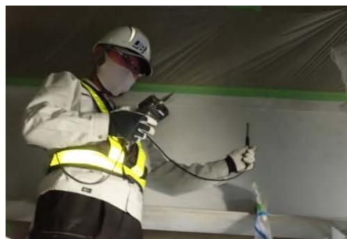
写真-1 換気の確認状況