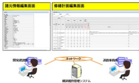
図 2.2 情報共有イメージ

事務所で作成した竣工図書や新設・補修・維持工事等の情報を使用しての本部での維持管理計画への活用や本部で作成した計画・設計を事務所で実施する補修工事でそれぞれ活用することを可能とした。