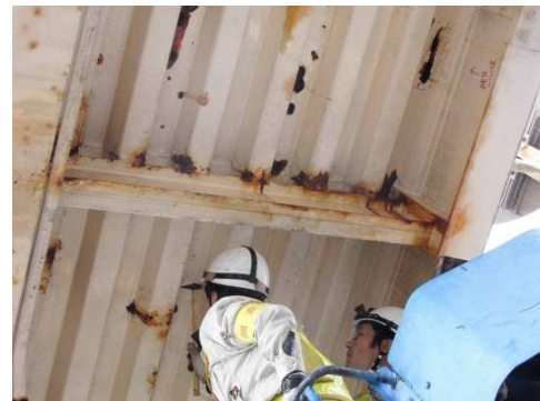
写真-1 床版(波型鋼板)の孔食

連絡先：埼玉県さいたま市大宮区吉敷町 1-89-1 タカラビル 2F 関東地方整備局 関東道路メンテナンスセンター 048-729-7780