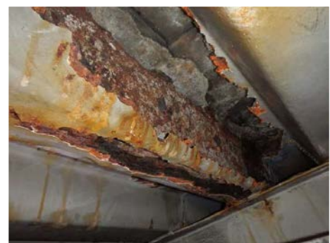
写真-3 広範囲に鋼板が喪失した床版