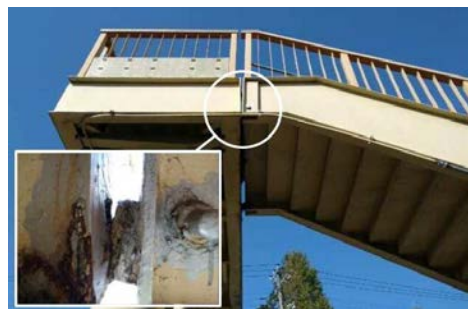
図-2 破断した階段桁のフック

役割を終えた歩道橋の撤去が進む一方で、今後も多くの利用者を見込まれる歩道橋も数多くあり、適切な維持管理が求められている。維持管理への要求水準は確保しつつも、効率的かつ合理的な維持管理へ取り組むべく、速やかにガイドラインを本格的に運用できるように努めてまいりたい。