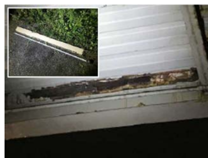
図-4 補修材が落下した床版