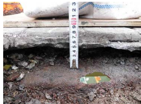
写真-2 充填コンクリートが喪失した舗装下