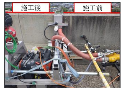
写真-3 表面処理状況

しかしランプ部規制では規制帯の幅員が狭くなるため、装置や工事車両の小型化が課題であり、今後これらの課題解決のための改良を実施検討したいと考えている。