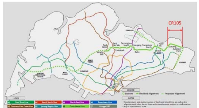
図 2 シンガポール島内クロスアイランド線位置図

クロスアイランド線はシンガポール東部に位置するチャンギ空港と西部のジュロンを結ぶ、全長約 50km の地下鉄新線である。CR105 工区はチャンギ空港敷地、及び空軍敷地直下をシールドマシンにて 3.2km 掘進する工事であり、且つ、シンガポール初の大断面シールド工区であることから、難易度が非常に高く、発注者も特に注力している工区である。加えて、本件は空港施設敷地内でのアンダーピニング工事（ジェット燃料パイプライン）も含まれており、高い施工管理も要求されている工事である。