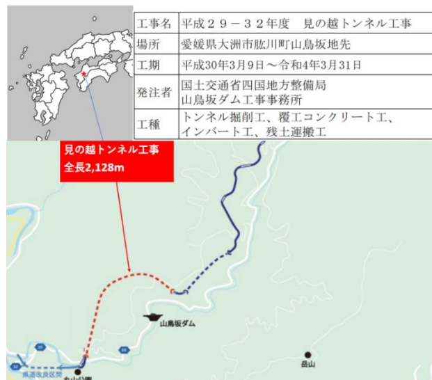
図 1 工事現場位置図

また坑内の通信環境として、一般的なトンネル坑内通信は、Ethernet(100BASE-TX 等)、DSL(Digital Subscriber