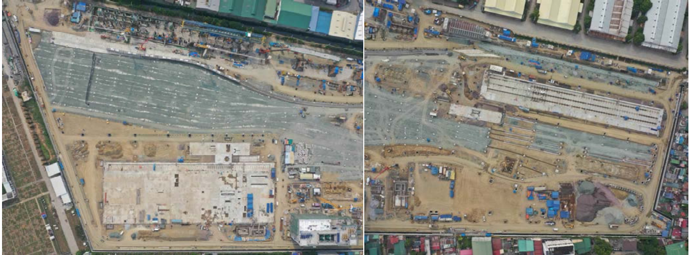
写真-1 マランダイ車両基地周辺