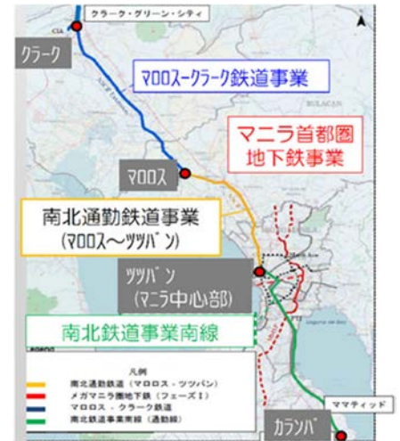
図-1 フィリピンの鉄道事業一覧

本工事では、17 の中間工期が契約上定められており、納期遅延にともなう損害賠償を回避するため、各職種間で土建の枠を超えた入念な事前計画・調整が必要となる。そこで、本線工事の橋梁上下部工、駅舎工事および建築の建屋工事が集約するマランダイ車両基地周辺に焦点をあて、工程管理に対する取組みを報告するものである（写真-1 参照）