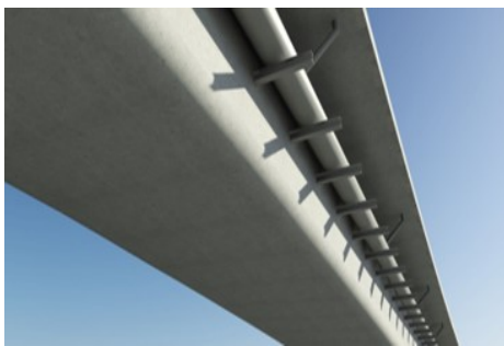
図-1 配管時想定外観図