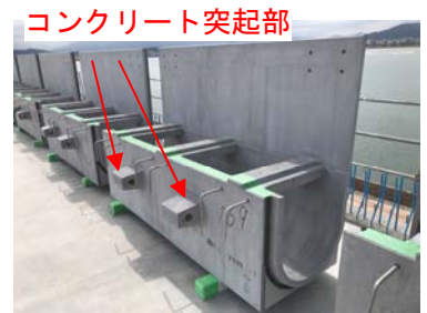
写真-4 PCa 側溝

PCa 側溝の取り付け部が劣化した場合、河川内や県道に落下する恐れがある。そのため、以下の2点によって取り付け部において冗長性を確保するような設計とした。まず、壁高欄および橋体の鉛直方向鉄筋を延長し、それらの内側に、連続した橋軸方向鉄筋を配筋した。次に、PCa 側溝の側面に設けたコンクリート突起部（写真-4）に貫通鉄筋（D22）を橋軸方向に連続的に通した。これらによって、間詰部を介して、橋体と PCa 側溝を RC 構造として一体化させた。