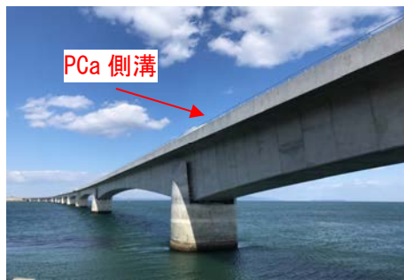
写真-2 PCa 側溝外観