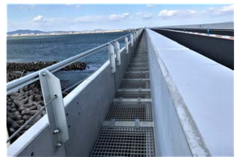
写真-3 PCa 側溝完成