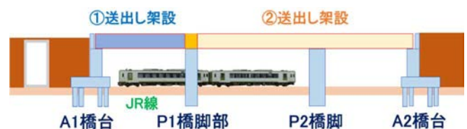
図-2 架設順序(当初計画)