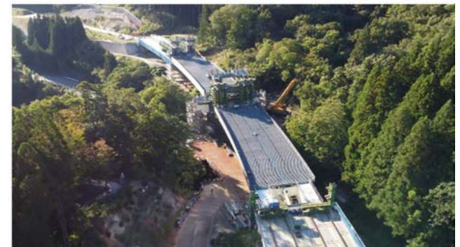
写真-5 送出し架設完了