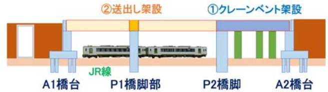
図-3 架設順序(計画変更後)

グレーチング床版の採用により、桁架設後に行わなければならない作業は大幅に削減され、床版コン