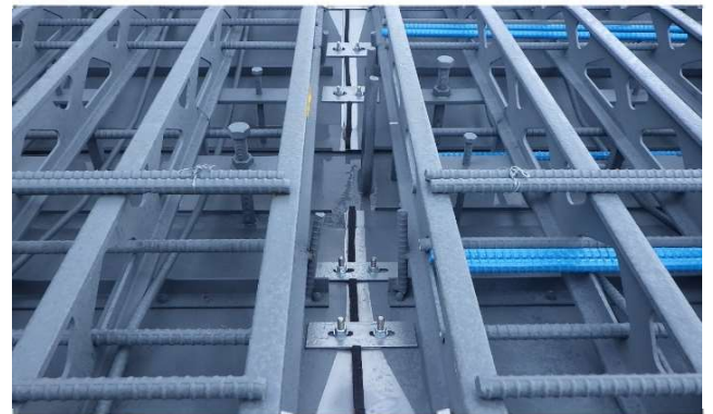
写真-3 グレーチング床版