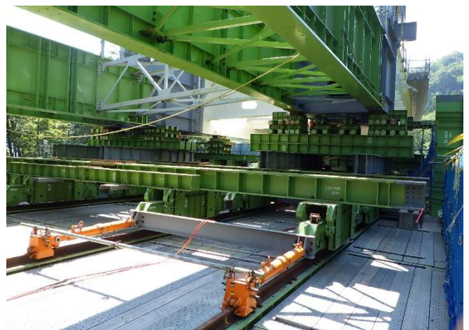
写真-2 送出し水平ジャッキ