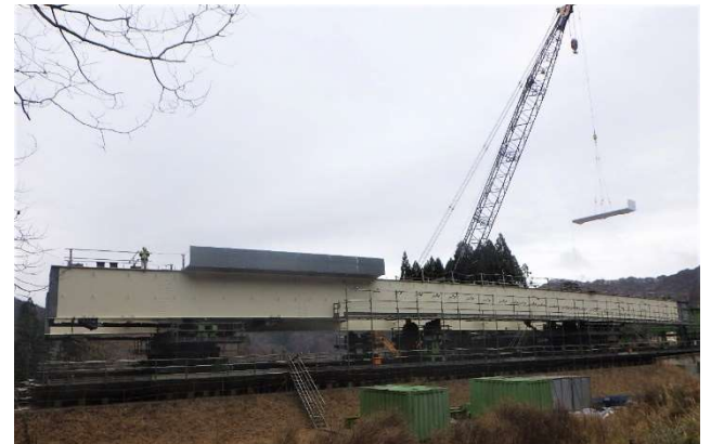
写真-4 送り出し桁へのグレーチング床版設置状況