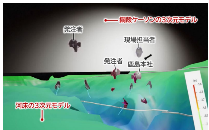
図-1 設計変更時の発注者説明の様子

連絡先 〒107-8348 東京都港区元赤坂 1-3-8 鹿島建設(株)土木管理本部生産性推進部 TEL03-5544-0602