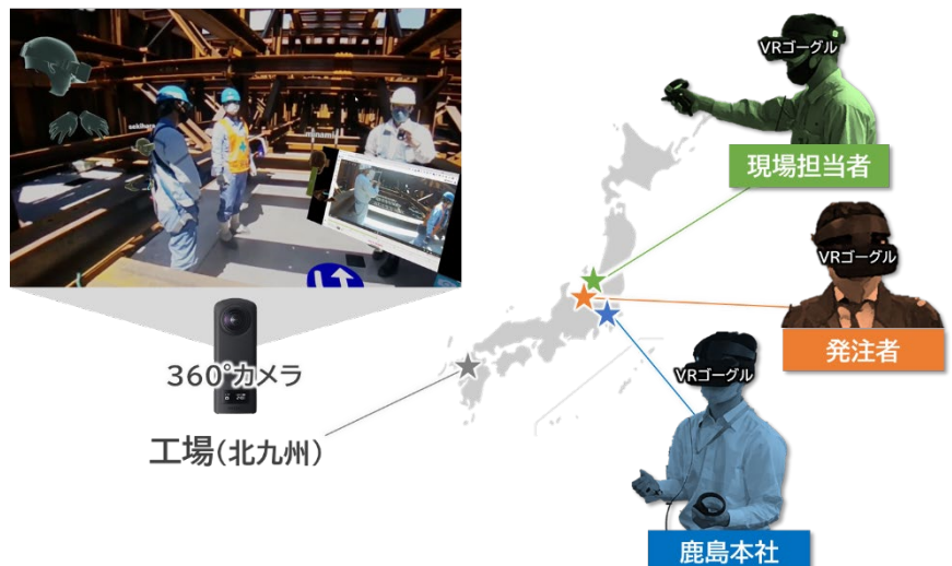
図-3 鋼殻ケーソンの遠隔立会検査時の様子

本工事の床固工に用いる鋼殻ケーソンは、北九州の工場で作られている。従来は、鋼殻ケーソンを現場へ運搬する前に、発注者と受注者が工場に集合して立会検査を実施していたが、関係者間の日程調整や遠方の工場への移動時間が課題であった。