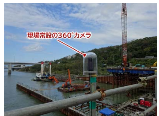
図-4 現場常設 360° カメラの様子

そこで、360°カメラを現地で立会する受注者職員に持たせ、カメラから配信されるリアルタイムの360°映像の中に本 VR システムを通じて発注者やその他の受注者が遠隔から入り込み、立会検査を実施した。これによって、従来は往復で3日、関係者4名での移動を要していた検査を、受発注者それぞれ1名のみでの移動で検査を実施できた。また、従来のウェブカメラを用いた遠隔臨場では、遠隔参加者の視界はウェブカメラを操作する現地職員のカメラワークに依存しており、受動的な立会検査となることが課題であった。360°カメラであれば遠隔参加者も自由な視点で、臨場感をもって能動的な検査を実施することができる点も大きな効果である。