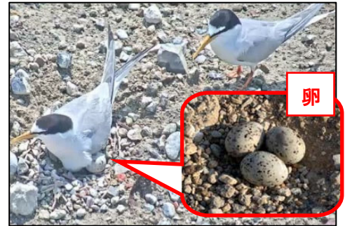
写真1 コアジサシ営巣状況

※コアジサシは、絶滅危惧Ⅱ類(環境省レッドリスト)、絶滅危惧ⅠB類(繁殖)(愛知県)に指定されており、営巣活動確認時点で鳥獣の保護及び管理並びに狩猟の適正化に関する法律(第八条 鳥獣及び鳥類の卵は、捕獲等又は採取等(採取又は損傷をいう。以下同じ。)をしてはならない。)が適用される国際希少野生動植物種に該当する。