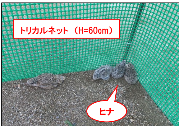
写真3 トリカルネット設置（外周）