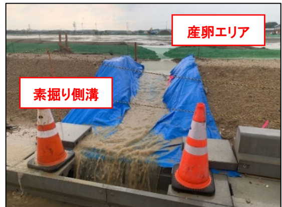
写真2 素掘り側溝による雨水排水状況