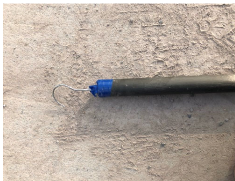
写真-2 導爆線集積棒

写真-2に当作業所で製作した導爆線集積棒使用状況を示す。これは、長さ3mの棒の先端にフックを付けたものである。ドリルジャンボのマンケージに乗ったトンネル作業員が、切羽から1m以上離れた位置から導爆線を集め、結束することが可能となった(写真-3)。