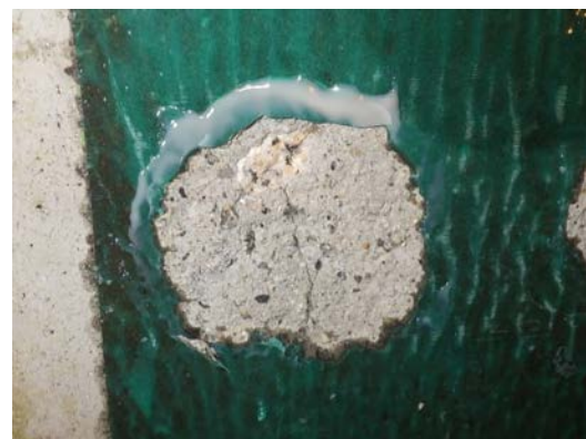
写真-3 最低値箇所破壊面

今回の試験から、施工性に優れた高圧洗浄と品質確保のための改質剤を用いた工法は、比較的健全な覆工コンクリートであれば従来工法と同等の付着強度が得られることが分かった。