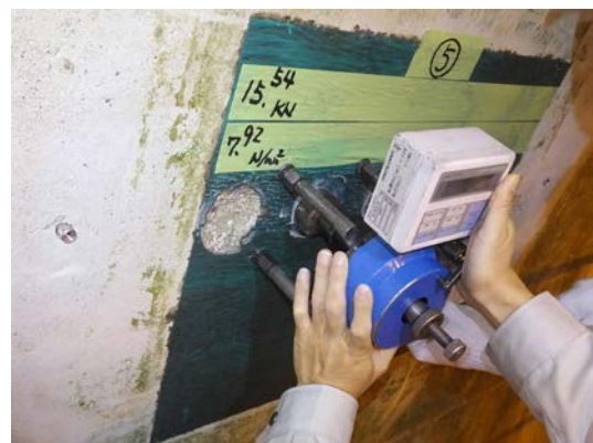
写真-2 付着試験状況