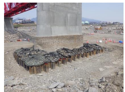
写真-3 P4 橋脚(仮)洗堀防止

そこで、初めに非出水期に橋脚を矩形に囲うように鋼矢板を打設し、洗堀防止時には、袋詰め玉石を橋脚周囲に固め置き根固めを行うとともに(写真-3)、盤下げ時や掘削時には橋脚の安定検討を考慮した山留支保工を設置した。なお、鋼矢板の打設では、対象地盤が玉石交じりの砂礫層であるため、パイルオーガーで最小限の掘削を行い鋼矢板を打設する「硬質地盤クリア工法」を採用した。また、桁下で空頭制限がある箇所ではリーダレス型基礎機械で玉石の破碎・削孔を行う「ダウンザホール工法」にて施工した。