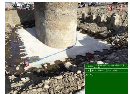
写真-4 P4 橋脚補強完了

次期非出水期には、薬液注入を行った後、鋼矢板内部を掘削し基礎底版拡幅コンクリートを施工した(写真-4)。この際、設計計算上では拡幅躯体のみで橋脚の安定は満足するが、洗堀防止用として残置した鋼矢板の変状防止のため、頭付きスタッドを設置して一体化した。