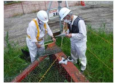
写真-2 部材個別検査状況

解体した部材は鉄道構造物等維持管理標準・同解説 1) に準拠し、近接目視及び触診による個別検査を行った(写真-2)。主な検査項目は①塗膜劣化と腐食状態、②リベットのゆるみ、③溶接部および母材の変状とした。①については大きな変状は無く、②については列車振動などによるゆるみが確認されたリベットは高力ボルトへ変換した。③については、落下時の衝撃・加圧によるものと思われる母材の変形が多数確認されたので、変形量が大きいものは新規部材に取替、加熱矯正可能なものは再利用とした。これにより、全体の約7割の部材が再利用可能と判定された。