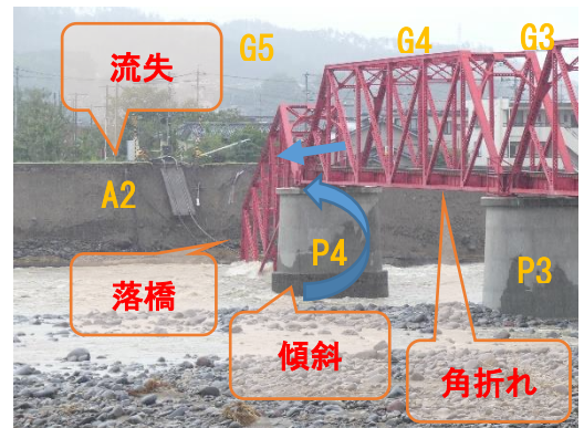
写真-1 千曲川橋梁被災状況

令和元年東日本台風は関東甲信越・東北地方を中心に記録的な大雨をもたらした。その内長野県では千曲川流域各地において堤防の決壊、欠損、氾濫などによる被害が多発した。上田市の当該橋梁交差部では左岸堤防が約300mにわたり欠損し、A2橋台が流失したことで第5径間(G5、約58t)が河川内へ落橋した。また、P4橋脚部では増水した河川により局所的に洗堀を受け、橋脚が上流側へと傾斜した。そのことにより第4径間(G4)ではP3橋脚上を起点にしてトラス桁が上流側へ角折れするように変位した。各部の被害状況を写真-1に示す。