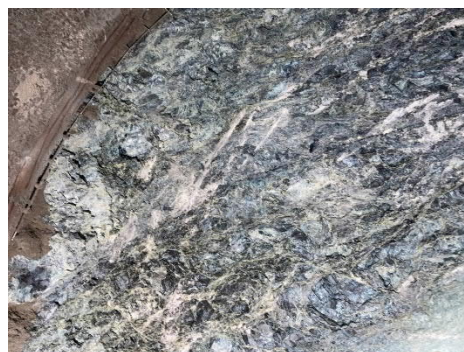
写真 1 切羽で確認された蛇紋岩