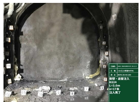
写真 2 追加した補助工法