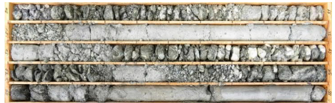
図2 蛇紋岩区間のコア

本工事では全線でノンコア削孔検層を行い、さらに蛇紋岩想定区間においては 50m 手前から水平コアボーリングを実施し、コアの確認を行った。採取したコアより蛇紋岩は当初想定位置に出現したものの、想定範囲 26m に対して、41m であることが確認された。