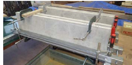
写真-1 使用したモックアップ

連絡先 〒104-0032 東京都中央区八丁堀 2 丁目 8-5 戸田建設株式会社 技術プロジェクト部 TEL 03-3551-1354