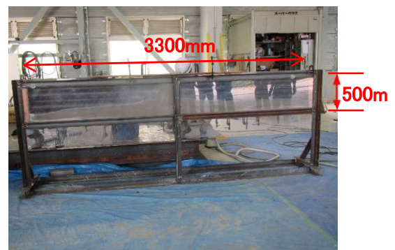
写真-2 充填性確認試験