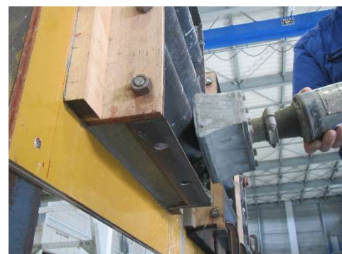
写真-3 急硬性確認試験