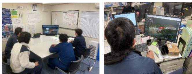
図-3 4D 施工情報の共有状況

現場職員と専門工事作業員などの人の動きについては、保護帽や建設機械に取り付けたビーコンセンサーから、現場に設置した受信器で人や機械の動きを取得した。このように、センサー情報から得られた作業計画に対する実績データがクラウドの基盤に蓄積されることで、業務における問題を早期に解決しながら、工程を促進できる利点がある。具体的には、この収集した作業データから建設における生産能力・投入量、機械の稼働率のデータをクラウドに集約・管理し、自動集計できることで、日々の最適な人員や機械のリソースの再配置計画が可能となった。図-4 に、現場での人員配置・集計システムの例を示す。さらに、資機材の情報を紐付けすれば、進捗段階でのコスト情報まで管理を行うことができる。これにより、コスト情報（5D）の基本となる作業工種における歩掛り原価の算出や、最適な工事計画の立案にも活用できる。