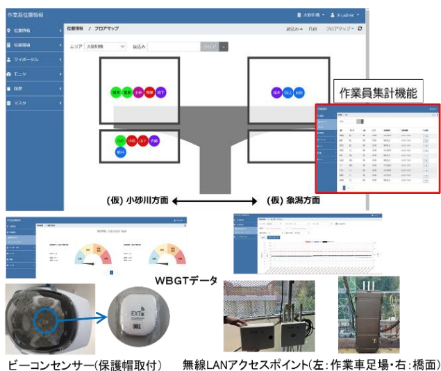
図-4 現場での人員配置・集計システムの例

現場職員と専門工事作業員などの人の動きについては、保護帽や建設機械に取り付けたビーコンセンサーから、現場に設置した受信器で人や機械の動きを取得した。このように、センサー情報から得られた作業計画に対する実績データがクラウドの基盤に蓄積されることで、業務における問題を早期に解決しながら、工程を促進できる利点がある。具体的には、この収集した作業データから建設における生産能力・投入量、機械の稼働率のデータをクラウドに集約・管理し、自動集計できることで、日々の最適な人員や機械のリソースの再配置計画が可能となった。図-4 に、現場での人員配置・集計システムの例を示す。さらに、資機材の情報を紐付けすれば、進捗段階でのコスト情報まで管理を行うことができる。これにより、コスト情報（5D）の基本となる作業工種における歩掛り原価の算出や、最適な工事計画の立案にも活用できる。