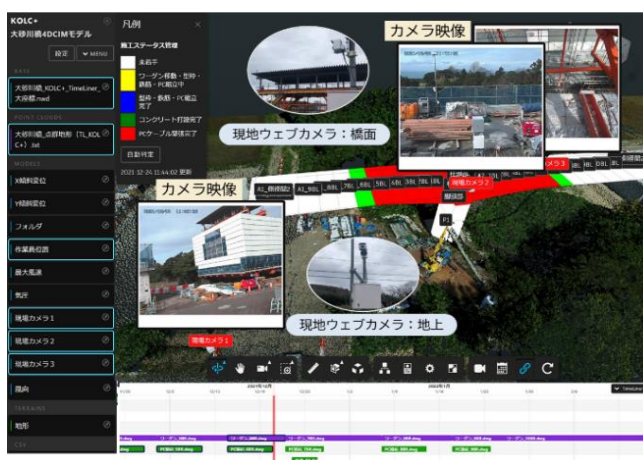
図-2 4D施工・出来高・品質情報クラウドの例

システムの構成は、クラウド上で工程を時系列に表示できる4D BIM/CIMによる工程シミュレーションや、日々の出来高や施工・品質情報を橋梁3Dモデルに格納しながら管理を効率化できる(図-2)。それに加え、プロジェクトの発注者や現場関係者などがそれぞれ多様な場所で各デバイス(PC、タブレットPCやスマートフォンなど)の画面上で、現地の人や機械の動きの情報を現地に赴くことなく、計画どおりの人員や機械の台