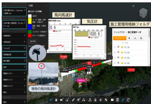
図-5 4D 施工気象センサー情報取得の例

将来におけるこのシステムの活用は、建設プロジェクトに関わる多くのステークホルダーが、業務プロセスを変革することができ、働き方が変わり生産性の向上ができると考えている。