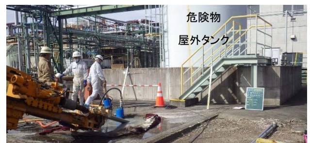
写真-1 斜め削孔状況