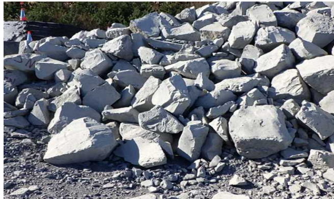
図-1 アッシュクリート固化体の破砕材

著者らは福島第一原子力発電所土木工事における石炭灰（原粉）活用の取組 1)~4) を進めている。本稿では鋼製ケーソンとして有効利用したメガフロート及び大型重量ブロックの基礎マウンドに用いた人工地盤材料(図-1 アッシュクリート固化体の破砕材)（以下、固化破砕材）の設計基準強度 10N、35N の動的変形特性について検討した繰返し大型三軸圧縮試験および試験前後にて実施した粒度試験の結果について報告する。