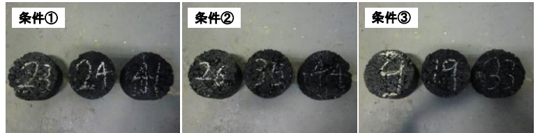
写真-2 それぞれの養生方法における試験前供試体外観 (150日)