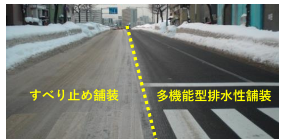
写真-1 凍結抑制効果の持続性