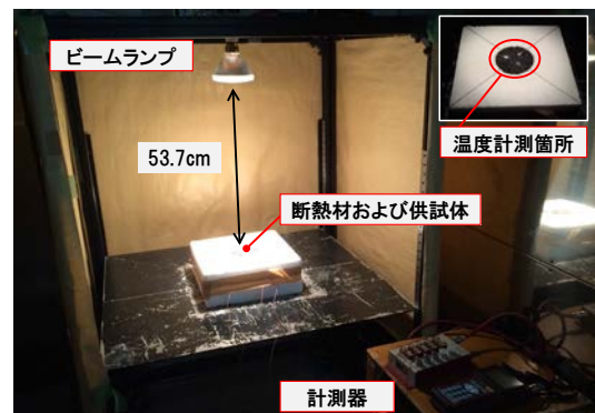
図-3 路面低減温度の測定状況