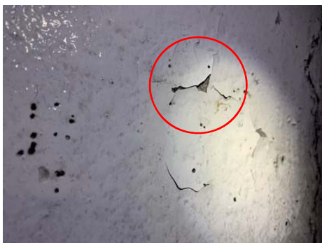
図-1 剥がれが生じたトンネル内の塗装

トンネル内装工はトンネル内の視環境を良好に保つ上で重要な役割を果たすものであるが、主流の材料であるタイルやパネルの脱落事象が度々発生し、脱落リスクの少ない材料が求められている。塗装材料は脱落リスクがなく有効な材料であるが、これまでは図-1 に示すとおり剥がれが生じる等、耐久性の観点から標準工法として採用されていない状況であった。近年、試験的に施工されている塗装による内装工について現地調査を行ったところ、塗装が剥がれている箇所については、湧水による影響等によるものと推察される事象の他に、母材側のコンクリート表面で剥離する現象が見られ、覆工コンクリートの表面状態が塗装の耐久性に影響を及ぼす可能性が確認されたため、各種素地調整を行った試験片を作製し塗装とコンクリート面との素地調整の相性について比較検討し、塗装による内装工の耐久性向上に向けた検討を行った内容を報告する。