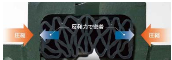
写真1. 止水ゴムの断面

本検討に使用した止水ゴムは、エチレンプロピレンジエンゴム製（以下 EPDM）である。分子構造的な特徴として、主鎖に二重結合を持たないことから、耐熱性、耐候性に優れるほか、比重が小さいなどの特徴が挙げられる。そのため、屋外で 사용되는ケースが多く、伸縮装置の止水ゴムには適した材料として実績も多い。また、検討対象とした止水ゴムの特徴は、パッキンとしての反発力を与えるためにハニカム形状で、 写真1 のように、冬季に床版遊間が広がった際でも、圧縮状態を保持できることである。