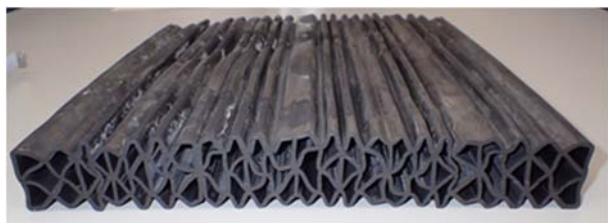
写真 4. 24年使用された止水ゴム (No.19)