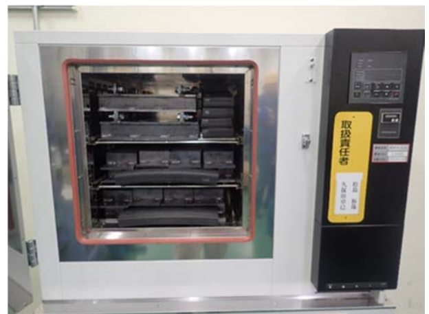
写真2. 熱老化試験状況

EPDM が耐候性に優れることから、実際の暴露環境においては酸化劣化が支配的であると考え、熱老化試験を行った。温度条件は、新材を用いた予備試験 1) を実施し 120℃とした。熱老化試験に供する試料は、止水ゴム新材から幅 114mm、長さ 100mm、厚さ 32mm の寸法を切出した。試料の種類は、拘束条件と物性変化の関係を確認するため、無圧縮状態以外に、伸縮装置としての最大遊間、標準遊間、最小遊間の合計 4 種類の拘束条件とした（ 写真3 ）。ゴムの物性試験は、老化試験前、1、2、3、7、14、30、60 日後に実施した。