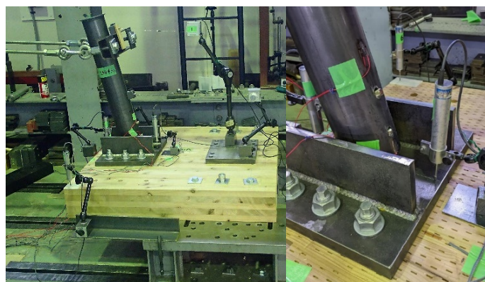
図 4 支柱の変形とベースプレート接合部 (LSB30d)