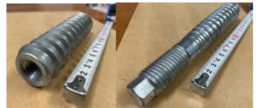
図 1 LSB（ラグスクリューボルト）

を LSB30d および LSB36d（各 6 本）、 \phi 24 mm のボルト 4 本でそれぞれ CLT 上面に接合し、鞘管に \phi