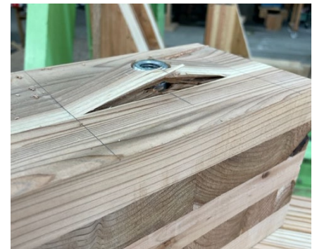
図 3 試験後の接合部 (LSB30t)