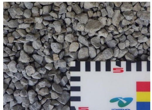
写真1 再生骨材の外観

本検討で使用する再生骨材は、JIS A 5021に適合する「コンクリート用再生骨材H」とし、6号サイズ（13～5mm）を用いた。再生骨材の外観を写真1に示す。コンクリート用再生骨材Hは、すりもみ処理等によりセメントモルタルの多くが除去されているものの、骨材のくぼみに残存したものや、少量ではあるがセメントモルタル塊の混入が確認されている。そこで、骨材の諸性状と混合物特性値について評価を行った。骨材性状およびアスコンの物理性状に関する検討項目を表1に示す。アスコンとしての評価は、密粒度アスファルト混合物（13）（以下、密粒（13））とし、表2に示すように0～100%の比率で6号砕石を再生骨材に置換えて配合設計を実施し、各物理性状の確認を行った。なお、バインダにはストレートアスファルト60/80を使用した。