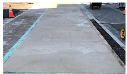
写真 2 施工完了