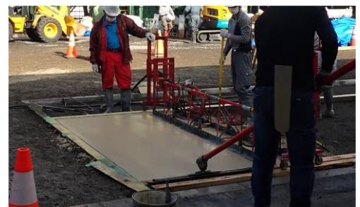
写真 1 施工状況