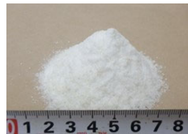
写真-1 廃 PET 樹脂

高耐久 PET アスコンは、改質アスコンに廃 PET 樹脂（写真-1 参照）を添加することで、耐流動性・耐水性・耐油性などの性能を向上させたものであり、混合物 1t の製造につき、およそ 11kg（500mlPET ボトル換算で約 125 本分）の廃 PET のリサイクルに貢献することができる。また、通常のアスファルト合材工場での製造、一般的な舗装用機械での施工が可能である。