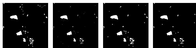
図3 氷河湖抽出画像 (2013年, 白:氷河湖)

像から作成して行った。2020年データから学習を行ったU-Netによる2013年データのF値は77.96%、2013年データから学習を行ったU-Netによる2020年データのF値は72.96%であった。どちらも同一のデータからモデル作成を行った場合よりも10ポイント程度F値が低下した。しかし、閾値法に比べるとF値が高値を示した。図3に2013年データの氷河湖抽出画像の一つの小パッチ(256×256画素)の例を示す。U-Net(学習:2013年)では小規模の氷河湖も抽出できていることが確認できる。