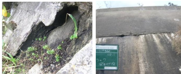
写真-1. 張コンクリート状況(左：基盤岩露出、右：打継目開口)

第 3 工区 ：法砕工(3.0m×3.0m)+砕内コンクリートが施工されている。中段から法尻にかけては補修が行われておりクラックが少ない。一方、中段から上方については未補修で剥落や豆板が多く植生が繁茂している。