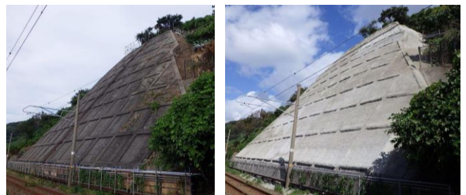
写真-2. 対策工(第3工区) 左：施工前 右：施工後

3工区について対策工を実施した。繊維補強モルタル吹付面積は、第1工区：1,059 m 2 、第2工区：188 m 2 、第3工区：1,069 m 2 とし、いずれも吹付厚は700mmとした。空洞箇所にはセメントミルクを注入し、既設モルタルとの付着力確保のため、せん断ボルト S-12-100 を2本/m 2 、スライド防止鉄筋を4.5 m 2 /本施工した。鉄筋挿入工は第1工区：90本、第2工区：42本、第3工区：313本を設置し、グラウト(セメントミルク)を充填した。引き抜き試験により設計引張力26.4kN以上となることを確認した。対策工後、安全性が確保されたため、2006年7月の斜面崩壊時に設置した災害検知装置を撤去した。