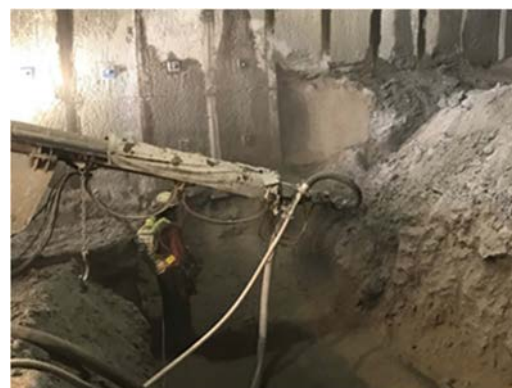
写真-1 吹付インバート施工状況

未施工区間の施工において、肌落ち災害防止の観点から12m以内の早期閉合を目標としたが、切羽面の固結状態がよく、鏡吹付で自立させることができたため、安全を確保し支保変状がないことを確認しながら、8m以内で断面閉合を行うことができた(写真-1)。