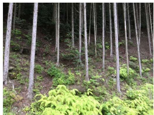
図-3 本調査地の斜面写真