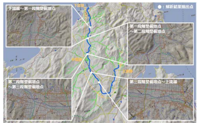
図-1 解析結果抽出点