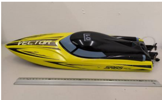
図-2 自律移動型浮子の外観

試作したロボット浮子は船体に市販のラジコンボートを使用し、全長約 64.0cm、横幅約 16.5cm、高さ約 14cm で、重さ約 1.7kg、静水時の吃水は約 7cm である。外観を図-2 に示す。ロボットの自律制御には、マイコンボードの Arduino およびオープンソースソフトウェアの Processing を用いた。Processing は浮子に搭載したスティック型 PC によって起動し、観測者がリモートデスクトップソフトウェアである AnyDesk を介して河岸から遠隔操作することで、ロボットの位置情報の確認や計測・帰還地点の設定などを行った。また、自律制御中は、ロボットに搭載した GPS およびコンパスセンサーからロボットの位置情報とヨー角を取得し、それを元に適当なメインモーターの出力およびラダー角度を算出した。