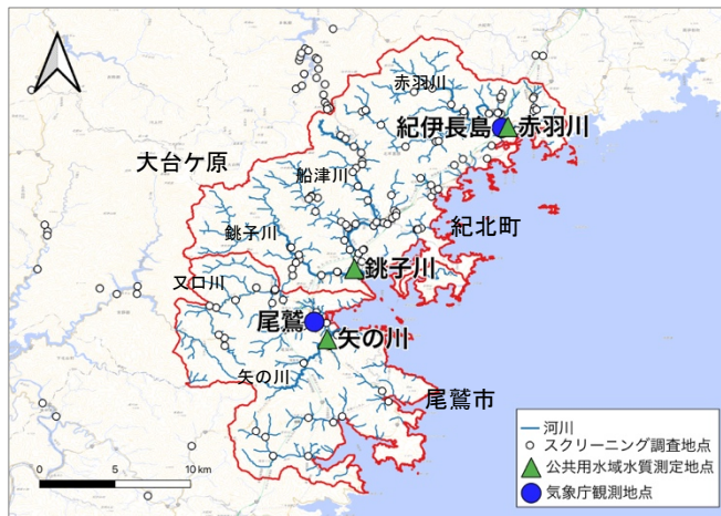
図-1 対象地域の水系と地点

資料・文献調査では、銚子川等についての文献の網羅的収集、地質・土地利用について情報収集した 4-6 。また三重県による公共用水域水質測定結果から域内 3 地点の 20 年間の水温、EC、pH の値を抽出した。加えて気象庁による気象データから域内 2 地点の同期間の降水量の値を収集した。スクリーニング調査は 2022 年 1 月 3 日～5 日にかけて、紀北町・尾鷲市を対象地域とし 121 地点で実施した(図-1)。調査地点は各水系の本川主要地点と主要支川の流末を基本に設定し、国土数値情報の流域メッシュで特定されている流域は全て網羅した。また可能な範囲で支川中流・上流にも地点を設定したが、銚子川上流部の本川、支川域はアクセスが困難でありカバーできていない。調査項目は現地で EC & pH 計(東亜 DKK MM-42DP)を用いて水温、EC、NaCl、pH、ORP の他、イオンメータ(HORIBA LAQUAtwin)を用いて Ca 2+ 、Na + 、K + 、NO 3 - 、別途気温を測定した。