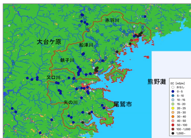
図-5 スクリーニング調査結果と土地利用図(緑が森林)

様の傾向がみられるものの、船津川、赤羽川流域など紀北町中央部、北部では5~10mS/mの傾向にあり、狭い範囲でありながら、水質形成要因のバックグラウンドが大きく2グループに分けられることが明らかになった。