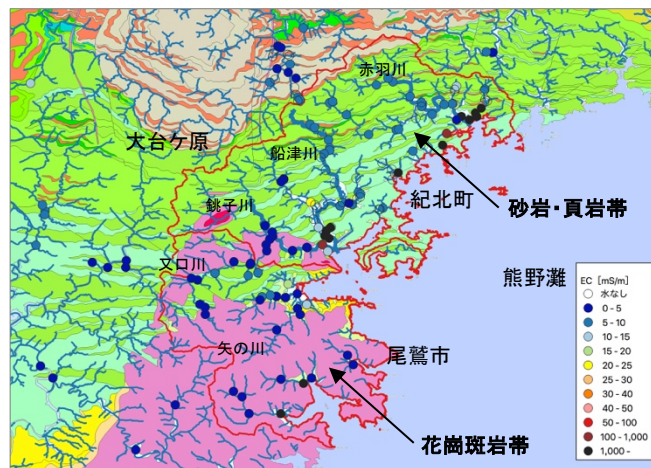
図-4 スクリーニング調査結果と地質図

以上の結果から、銚子川流域に代表されるECが5mS/m以下の傾向は矢の川流域など尾鷲市域でも同