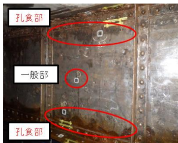
図-7 一般部と孔食部の例