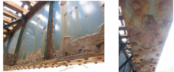
図-1, 2 腐食状況

当社では日本海沿岸を縦貫する線区を管理している。当線区は厳しい塩害環境下にあるため、腐食が著しい鋼橋りょうが多く存在し、維持管理に苦慮している。鋼橋りょうの維持管理として、定期的に塗替え塗装を行っているが、塗替え後数年で再腐食した事例が確認されている。（図-1, 2）塗膜の長寿命化のためには塗替えの際の素地調整段階において、いかに塩分を除去できるかが重要となる。今回、塗替え塗装を行った橋りょうにおいて塩分量測定を行い、効果的な塗替え手法を素地調整の観点から検討した。