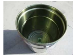
写真-5 ペール缶内部