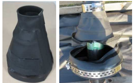
写真-1 開閉式ケーブルカバー

写真-1 に示す開閉式ケーブルカバーは、変位追随性を確保し、PE 被覆と取り付け部の両方の負担軽減に配慮しつつ耐候性、耐久性、経済性も考慮してゴム引き布性とした。開閉式ケーブルカバーの点検用開口部は水密性のあるファスナーとした上で、雨水が直接当たらないように覆いをラップさせている。ケーブルおよび定着管との取り付け部の両端開口部は防水パッキンを密着させたうえでバンドにより締め付けることで容易に脱着可能な仕様とした。なお、カバー全体は縦に点検用開口部同様のファスナーで完全に分離開放できるため、供用後の交換が容易に行える工夫をしている。