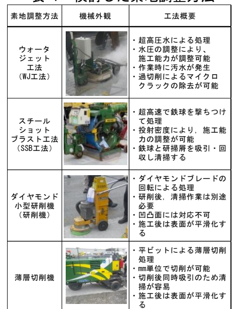
表-1 検討した素地調整方法

素地調整後の床版面の粗さは表-2 に示す方法で測定した。サンドパッキング法と Circular Track (以下、CT)メータ法は舗装調査・試験法便覧 4) に記載の方法である。CTメータ法については A から H までの分割した区間ごとのプロファイル深さから平均プロファイル深さ(MPD)を算出することの他にレーザーセンサから得られた変位の標準偏差を算出し、表面粗さの評価を行った。型取りゲージによる方法は、試験法便覧に記載されている試験方法ではないが、現場管理の容易さを考慮して、本実験に適用することにした。