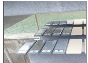
暴露試験 7か月経過