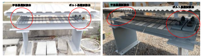
(a) 辺野喜暴露試験場