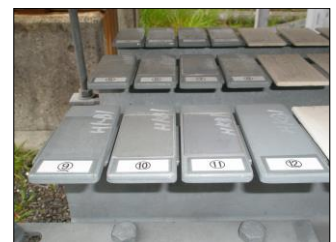
暴露試験 8か月経過