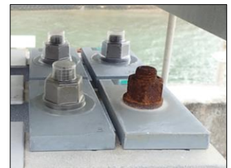
暴露試験 7か月経過