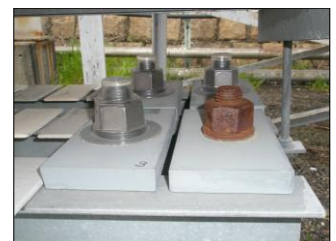
暴露試験 8か月経過