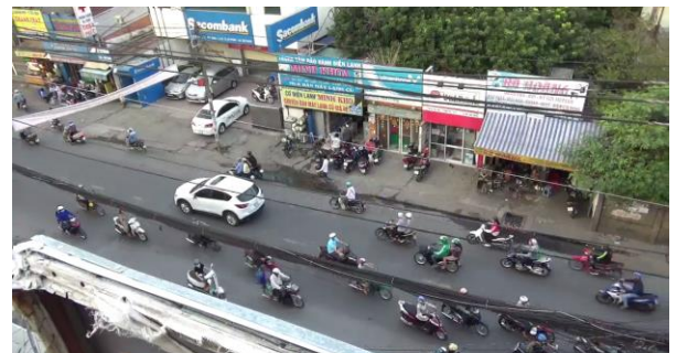
図-1 Le Van Viet 通りの交通状態

本研究の手順として、第一段階に対象区間にてビデオ調査を行った結果より、QK図を作成し交通状況を把握する。第二段階では第一段階で取得したビデオデータから解析に用いる画像データをもとに既往研究の手順を用いて、車両間スペースを簡略化し、数値化することにより、対象区間の車両間のスペースの大きさを定義する。その後、車両毎の速度を計測し、車両間のスペースの大きさと平均速度の関係マクロ的な視点での分析を行った。