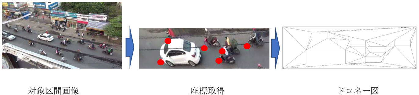
図-3 ドローネー図作図イメージ

ビデオデータより、抽出した道路区間画像を用いて、ドローネー図を作成する。初めに、ビデオデータより取得した画像データを射影変換し、平面の画像に補正する。補正した画像より、車両の左下の座標を抽出する。抽出した座標をもとに区間の面積と車両の位置を定義し、各車両の頂点と区間頂点同士を結ぶ三角形でドローネー図は描かれる。ドローネー図中の三角形の合計の長さの平均を車両間スペースの大きさと定義する。例として、図-3 に四輪車 1 台二輪車 5 台の道路状態のドローネー図作図手順を示す。