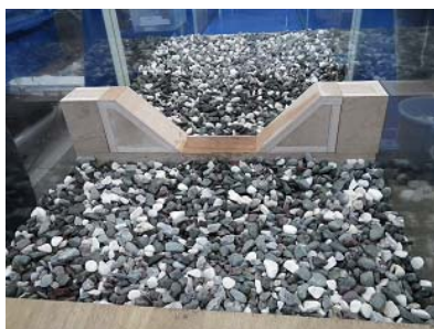
写真1 複断面型えん堤模型