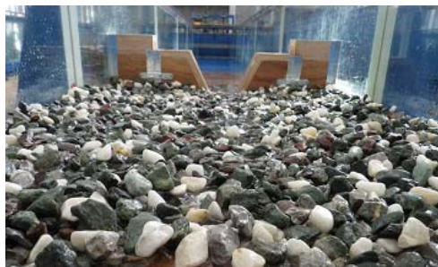
写真2 広放物線形状の河床 Case A