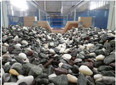
写真3 複断面形状の河床 Case B

キーワード 治山えん堤, 複断面化, 洪水流, 減勢工, 跳水, 洗掘形状, 河床低下