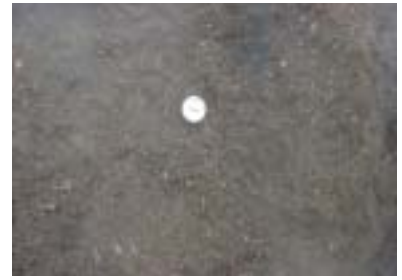
写真 - 2 堆肥化物温度測定状況