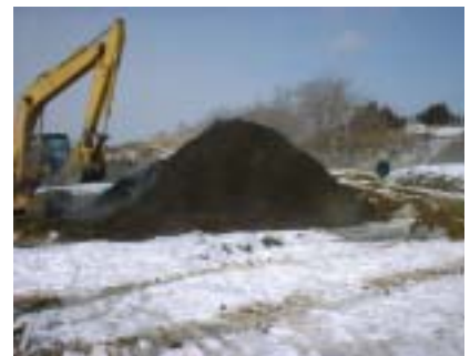
写真-1 現場発生木材堆積状況