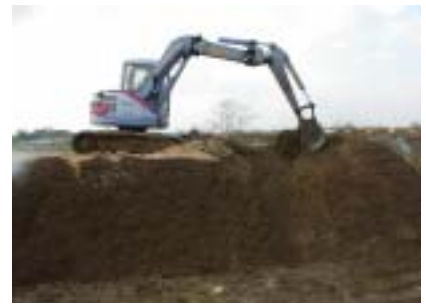
写真 - 3 副資材添加状況