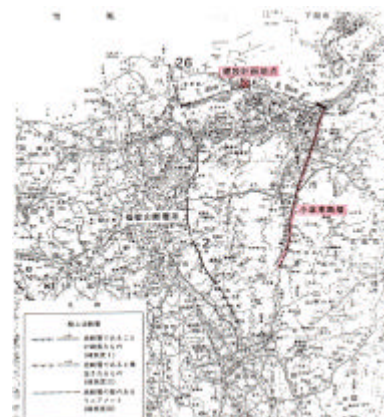
図 - 4 活断層分布図

本トンネルにおいては、北九州市の地域防災計画に準ずることとしたが、そこでは「北九州市近傍で発生するM 6.5 程度の大規模地震を想定する」と明確な活断層等が示されていないこと、活断層の状況等を鑑み、経済性と安全性の面からレベル2地震動と照査用地震動の2種類を設定し、各々個別に検討することとした。