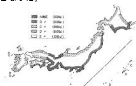
図-1 最大加速度の地域区分

また、レベル1地震動は、十勝沖地震(八戸港観測記録)若しくは宮城県沖地震(大船渡港観測記録)を検討対象として地盤の応答解析を行ったところ、航路部中央から若松側にかけて沖積層が分布しているといった地盤条件により八戸港観測記録による応答値(地盤変位)の方が卓越する結果となった。このため、本検討では八戸港観測記録波形を採用することとし、道路法線も全体的に曲線を有するため2方向から加振することとして縦断方向の検討を行った。図-3に地盤振動の方向を示す。