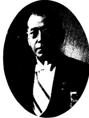
第 17 代 故 工学博士 田邊 朔郎君