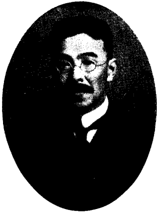
第 11 代 故 工学博士 中山秀三郎君