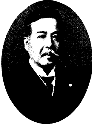
第 6 代 故 工学博士 広井 勇 君