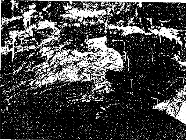
寫眞第一 穹拱の剝脱