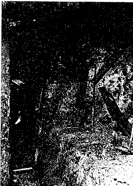
寫眞第三 側壁の龜裂及び裏の状態