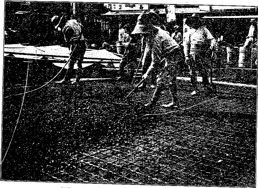
(5.5ミリ線 網目 125ミリ ト 144ミリ 使用)