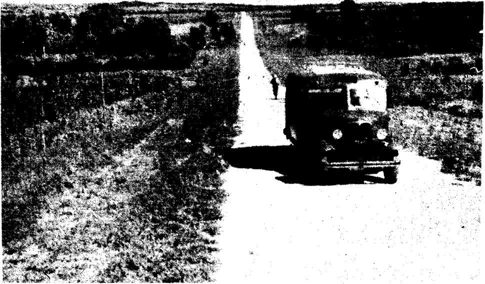
京吉國道石碑嶺附近